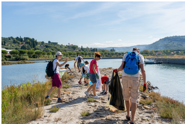
Čiščenje v Strunjanu

V povprečju smo na 100 m slovenske obale zbrali 158 kosov odpadkov, ali točno 1 kg odpadkov.