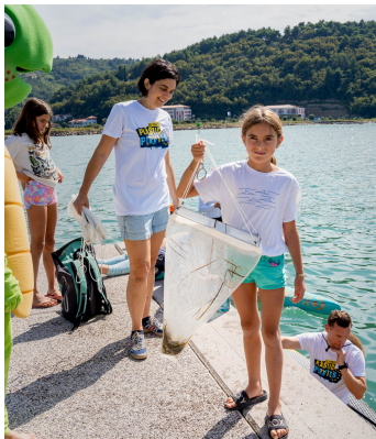
Vzorčenje mikroplastike s Pirati plastike

Po treh letih premora, smo se letos zopet družili z vsemi prostovoljci v Strunjanu. Ob dobri "zero waste" malici smo pod borovci na plaži Krka Strunjan spoznavali svet odpadkov z raziskovalci Nacionalnega inštituta za biologijo Morska biološka postaja ter inštituta RS za vode, ki skupaj delujejo kot Pirati plastike. Pridružila se nam je tudi ekipa Naredi nekaj za naravo, ki je mikro odpadke iz vode pobirala s SUP-om. Ekologi brez meja so zopet popisali blagovne znamke odpadkov, da spodbudijo proizvajalce, da njihovi odpadki ne bi več pristali v naravi. V sklopu projekta REMEDIES so nam raziskovalci s Kemijskega inštituta pokazali, kako izdelati svojo kozmetiko brez plastične embalaže in kako določiti tip plastičnih odpadkov s pomočjo prenosne naprave NIR. Tradicionalno pa je potekal še ogled solin Krajinskega parka Strunjan.