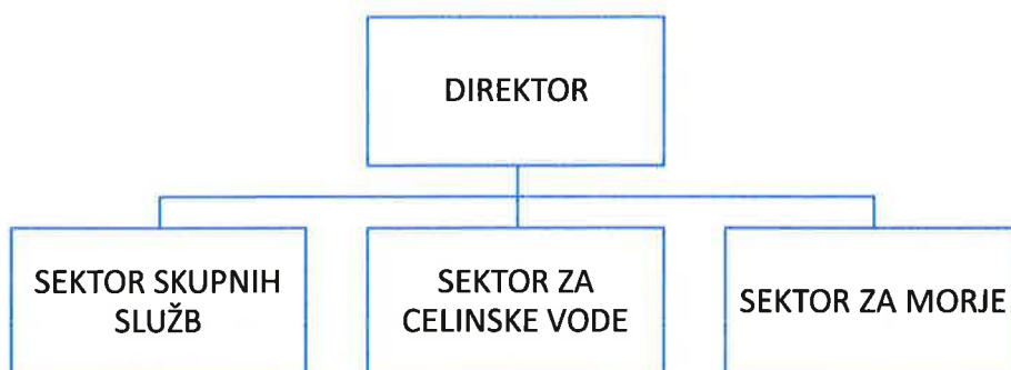
Slika 1: Organigram Inštituta za vode republike Slovenije

Za izvajanje registriranih dejavnosti je inštitut po veljavnem statutu organiziran v organizacijske enote: