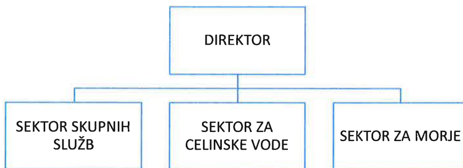
Slika 1: Organigram Inštituta za vode republike Slovenije

Za izvajanje registriranih dejavnosti je inštitut po veljavnem statutu organiziran v organizacijske enote: